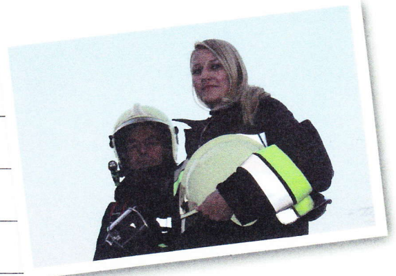
Mitglieder einer Freiwilligen Feuerwehr